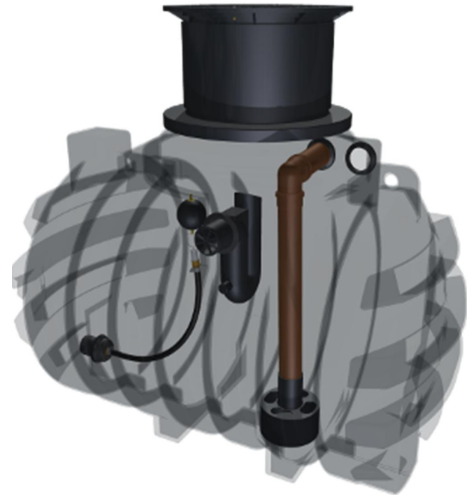
telescopic dome Schiebedom 1:15

for terrain adjustment tilt up to 5° horizontally 5° 5° im ausgezogenen Zustand zur Geländeanpassung bis 5° waagrecht neigen